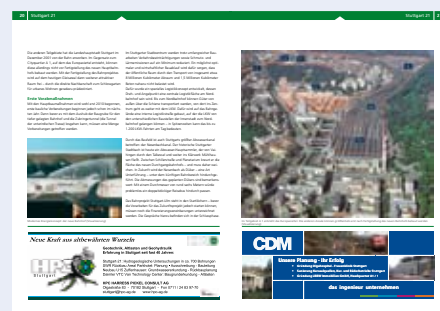
Stuttgart Baut, Heft 6