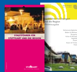
Stadtführer für Stuttgart und die Region, inklusive Messeausgabe